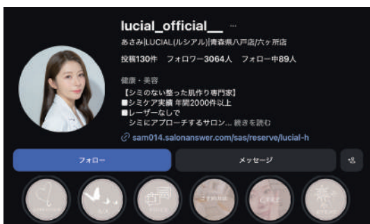
新規顧客獲得にSNSを活用

この仕事の醍醐味は、自分の手で誰かの人生を変えられること。肌がキレイになると自信が生まれ、行動が変わり、人生が好転していきます。お客様の变化を間近で応援し、喜びを共有できる。これほど素晴らしい仕事はありません。