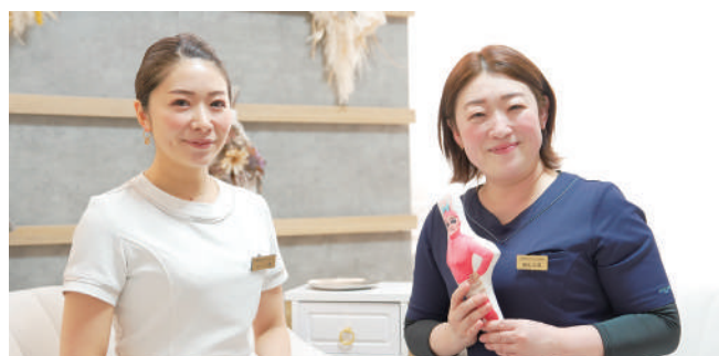
スタッフの働きやすさにもコミット