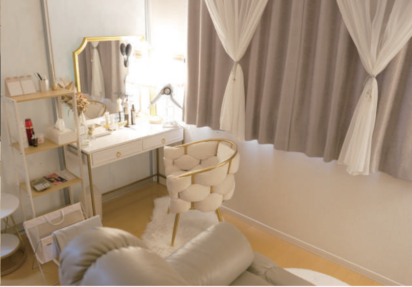
根本的な肌の力を育てることに注力