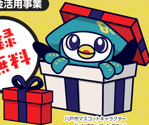
八戸市マスコットキャラクター 「いかずきんズ かぶさん」