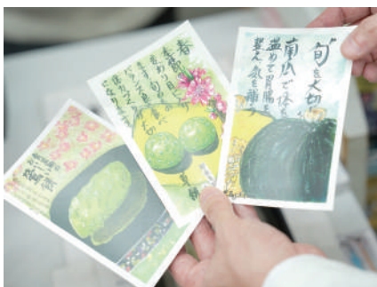
温かみが伝わる絵手紙のダイレクトメール