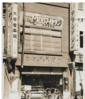
街に根差して86年。これからも暮らしを支える

2040年、弊社は創業100年を迎えます。若い世代が挑戦しやすく、暮らしやすい子育てしやすい八戸であってほしい。そのために地域のいち企業として貢献したいです。八戸は行政も市民の目線に立って寄り添ってくれる、非常に温かく魅力的な街です。100年目のその先も、みなさんと一緒にこの街の未来を描いていけたら幸いです。