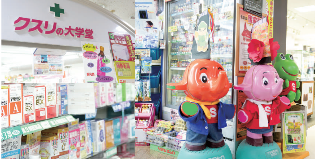
さくら野1階の店舗。所狭しと商品が並び