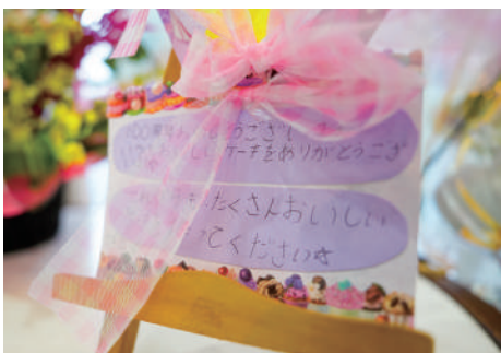
世代を超え、たくさんの方々が祝った100周年

私は自分を「職人」と捉えています。自分の作ったものを選んでもらうだけでなく、お客様が求めるものを作ることが喜びです。今はケーキ作りが楽しく、趣味がいらないほど毎日充実しています。ケーキは幸せな場面を彩る食べ物。作る人が優しい気持ちで作らないと、食べる人にも伝わってしまいます。自分たちが毎日楽しく働ける環境を追求しながら、これからもケーキ作りに励んでいきます。