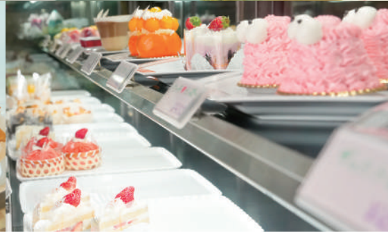
食べる人の人生に寄り添う、色とりどりのケーキが並ぶ