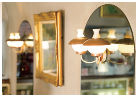
懐かしく、温かみのある店内