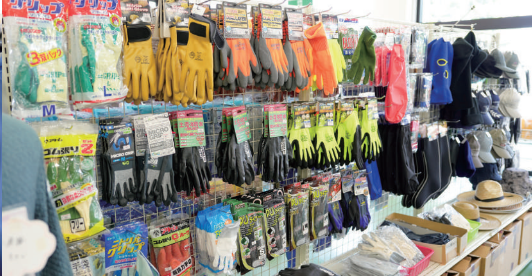
豊富な品揃えが漁業従事者からも支持される