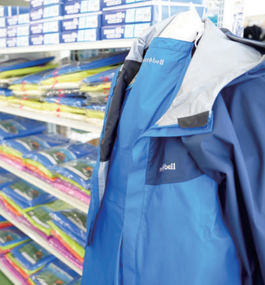
機能性とデザインを兼ね備えたカッパが人気