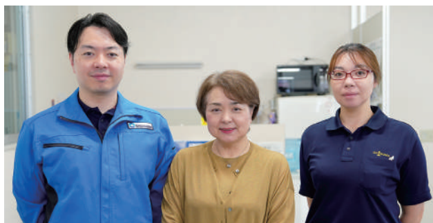
家族の絆で八戸の漁業を支え続けている