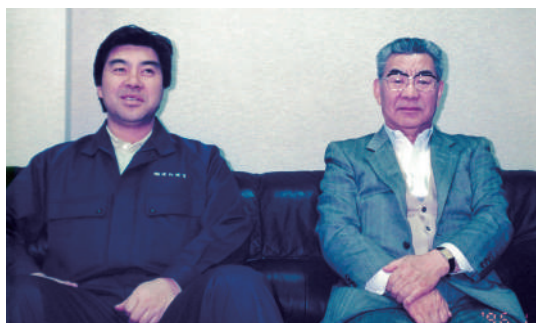
祖父から父へと受け継がれてきたオカヌマの歴史

八戸の港の景色は昔と比べて変わりました。「活気がなくなっただ」とこぼす人もいますが、私はそうは思いません。昔とは違う、今の時代の新しい活気が生まれていると感じるからです。祖父から父へ、父から私へと受け継がれてきた歴史を土台に、時代の変化に適応しながら、これからも地域に根差した経営を続けていきます。