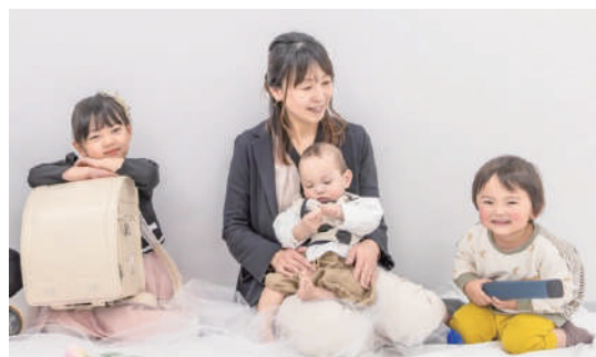
子どもたちとの賑やかな毎日。「1日100回は叫んでいますね」と笑う

オープンした頃、大きなオブジェの注文がありました。資格を持たない私でもやり切れたこと、お客様に喜んでくれたことが自信になり今につながっています。お店の経営は大変なことはかりですが、自分が手がけたものでお客様を笑顔にできるこの仕事は止められないですね。