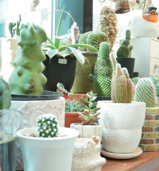
多肉植物は初心者にもおすすめ。育て方のコツも教えてくれる