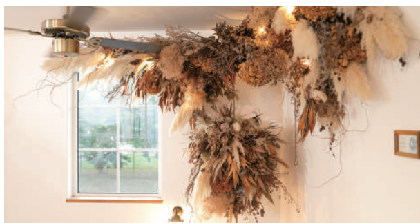
店舗を彩る大きなオブジェ。自信を持つきっかけのひとつ