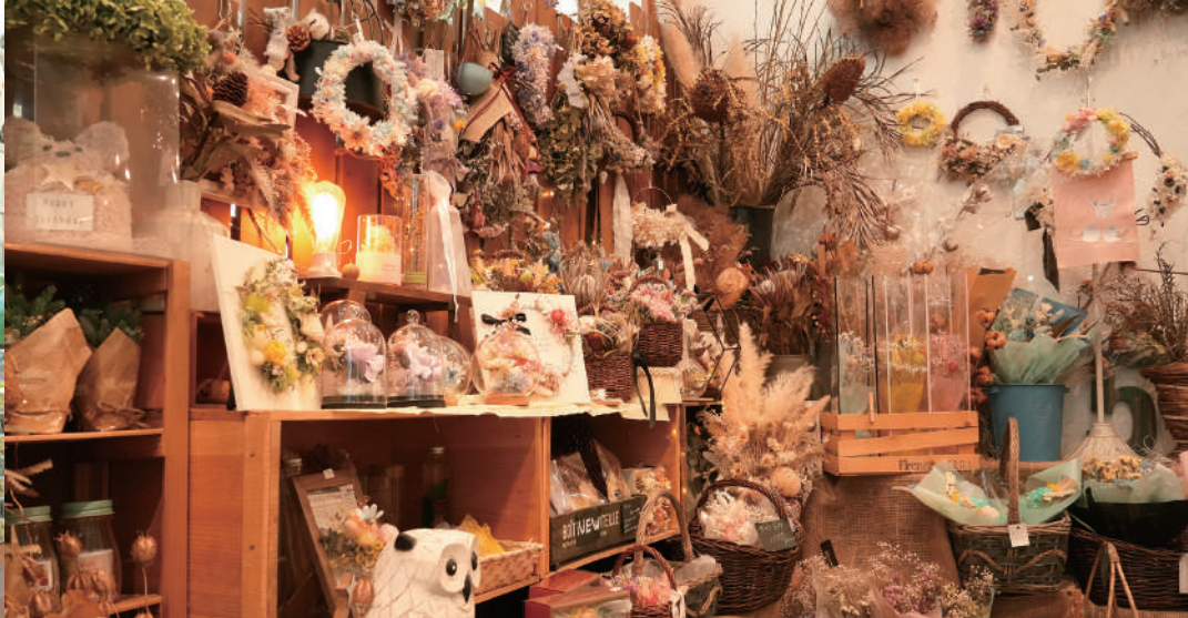
所狭しと商品が並び、見ているだけでワクワクするお店